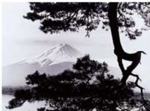
在河口湖湖滨 1950 年左右