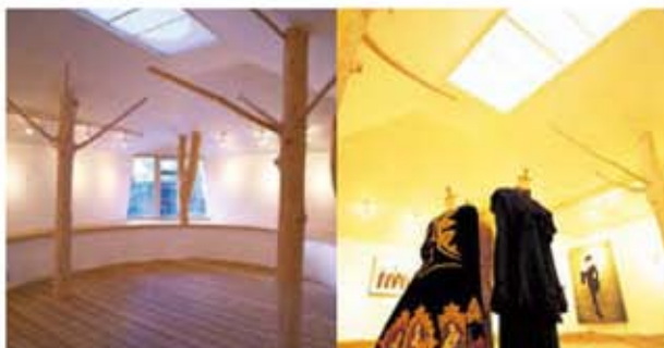
<Maniko Kohga 25th Anniversary Exhibition> 2003

在二楼展示厅时常举办企划展，以国内外的新露头角的艺术家为企划展。我们美术馆举办由创作者演讲会和画廊会谈以及举办以箱根的四季为主题的摄影教室。